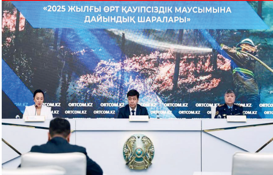
«2025 ЖЫЛҒЫ ӨРТ ҚАУІПСІЗДІК МАУСЫМЫНА ДАЙЫНДЫҚ ШАРАЛАРЫ»

Көктем мезгілінің келуімен өрт қауіпі жоғары кезең басталады. Бұл маусым еліміздің оңтүстік және батыс өңірлерінде 26 наурыздан, солтүстік және орталық өңірлерде 7 сәуірден, ал шығыста 14 сәуірден басталады.